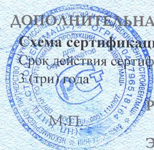
Схема сертификации: 3 Срок действия сертификата 3 (три) года